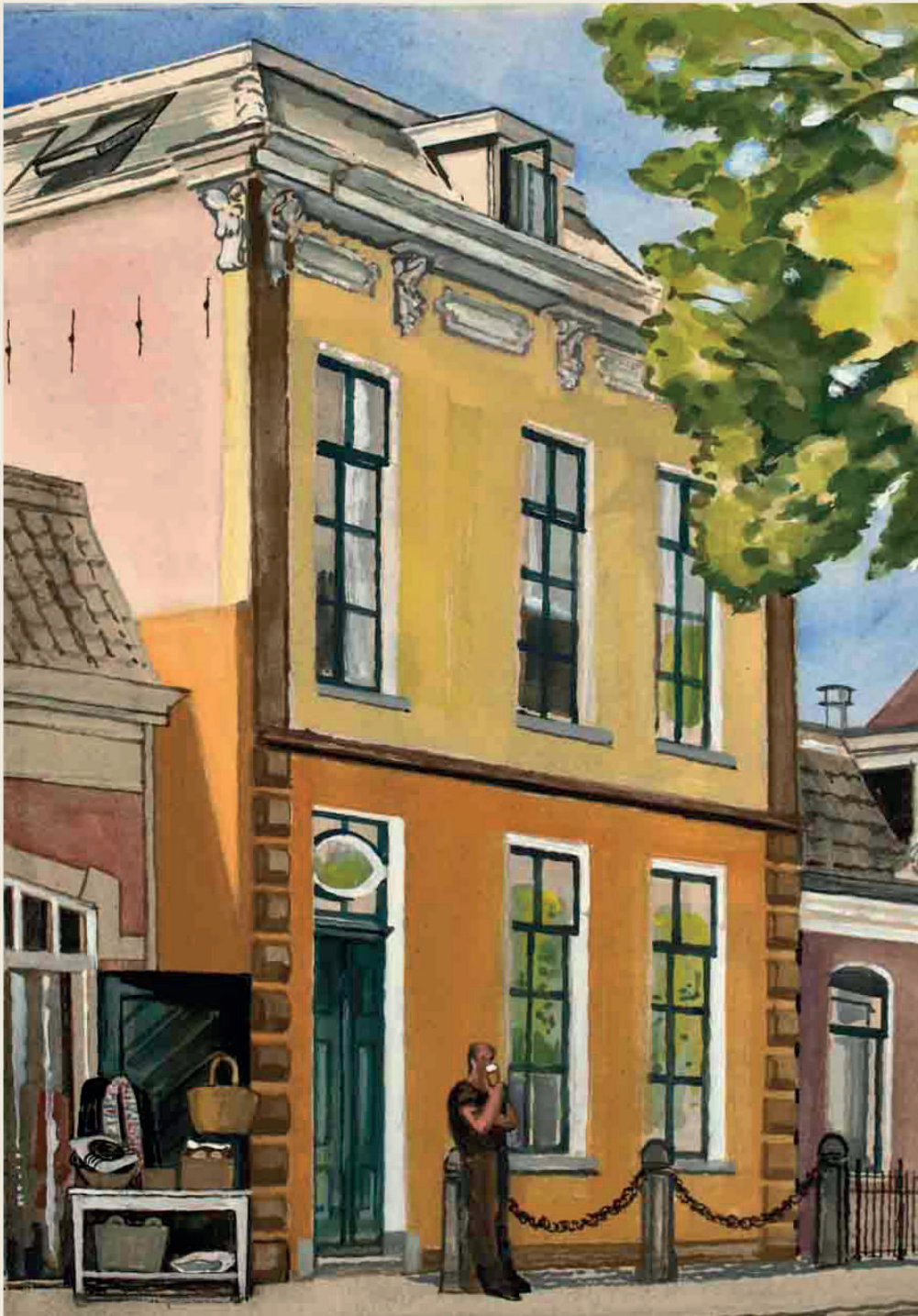
Theo de Feyter, Eysingahuis, 2018

www.historischbeetsterzwaag.nl Beetsterzwaag - 14 sept. 2024