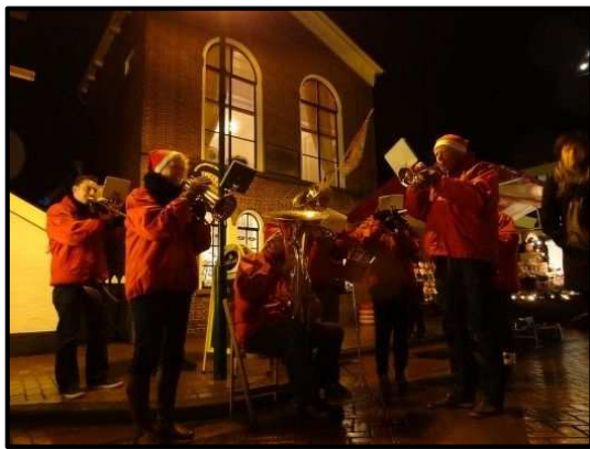
Muzikale omlijsting Kerstfair 2014

De novemberstorm blaast om het huis. De temperaturen zijn veel te hoog en de winter lijkt nog ver weg. Die mooie beelden van de ven van eerdere winters, waar werd geschaatst en met arrensleeën gereden, komen in mij op. Ook de dikke pakken sneeuw, die zorgden dat burens tijd hadden voor een praatje met elkaar op straat tijdens het sneeuwschuiven en waar met sleetjes boodschappen gedaan werd: heerlijk! Met de nieuwe Bosheuvel hebben we er ook een geweldige slee-plek bij gekregen, dankzij ons actieve (jonge) inwoners. En straks, als op 9 december de Kerstfair ons weer mee terug neemt in de Dickens-periode, met knapperend haardvuur, lekkere hapjes en muziek, kijk ik dus reikhalzend uit naar de eerste sneeuwvlokken.