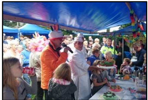
Heel Beetsterzwaag Bakt" voor 700-jarig jubileum van het dorp tijdens Open Monumentendag.

Samen met alle plaatselijke belangen van de gemeente hebben we op 4 november jl. onder het genot van stamppot gesproken over hoe we als burgers, samen met de gemeente, kunnen bouwen aan onze gemeenschappen. Hoe ver laat de gemeente los en hoeveel willen we zelf op ons nemen. Daarbij werd het groenonderhoud als voorbeeld gebruikt. De zaal was verdeeld over de mogelijkheden. Met name was er zorg over de last op de schouders van de beperkte hoeveelheid vrijwilligers.