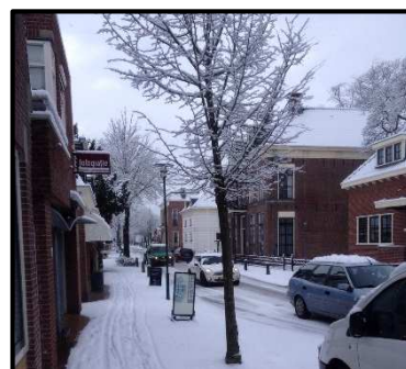
Winter in Beetsterzwaag, Februari 2015