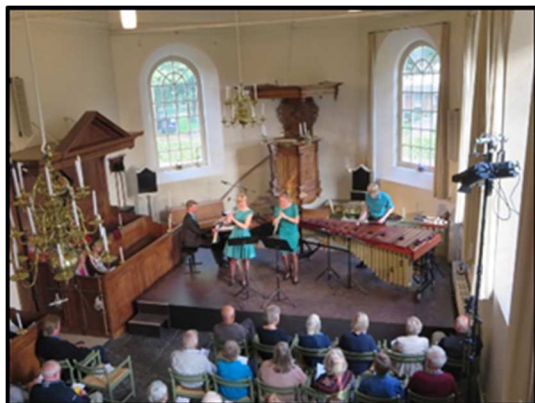
Meer dan 100 bezoekers voor Cult Bee herfstconcert van Jong Fries Talent: Colori Ensemble en Hessel bij de Leij in de Dorpskerk

Voor 2016 heeft het Plaatselijk Belang nog een ruim dorpsbudget onder haar beheer. Dit budget is voor een eenmalige bijdrage aan projecten of activiteiten die een bijdrage leveren aan de leefbaarheid in het dorp, waar voldoende draagvlak voor bestaat. Voorwaarde is wel dat de gemeente niet op een andere wijze een bijdrage is gevraagd voor het project / de activiteit. Dus heeft uw buurtvereniging, sportvereniging, werkgroep of ander initiatief een idee met nog een uitdaging in de begroting, meldt u met uw plan (incl. financiële onderbouwing) bij Plaatselijk Belang. Zo kunnen we samen ons dorp aantrekkelijk houden!